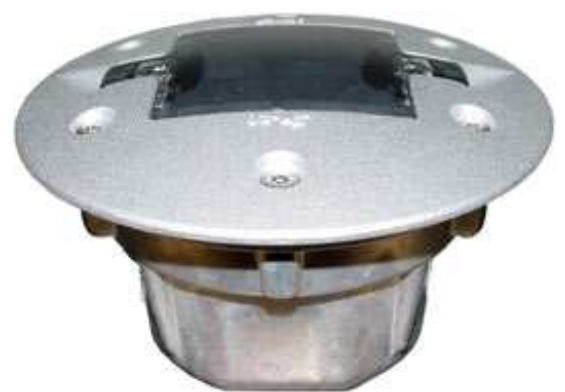
Ανακλαστήρας Οδοστρώματος DS-SR20

Το σύστημα μπορεί να τροφοδοτηθεί εξ' ολοκλήρου από φωτοβολταϊκό σύστημα για εξοικονόμηση ενέργειας και αυτονομία.